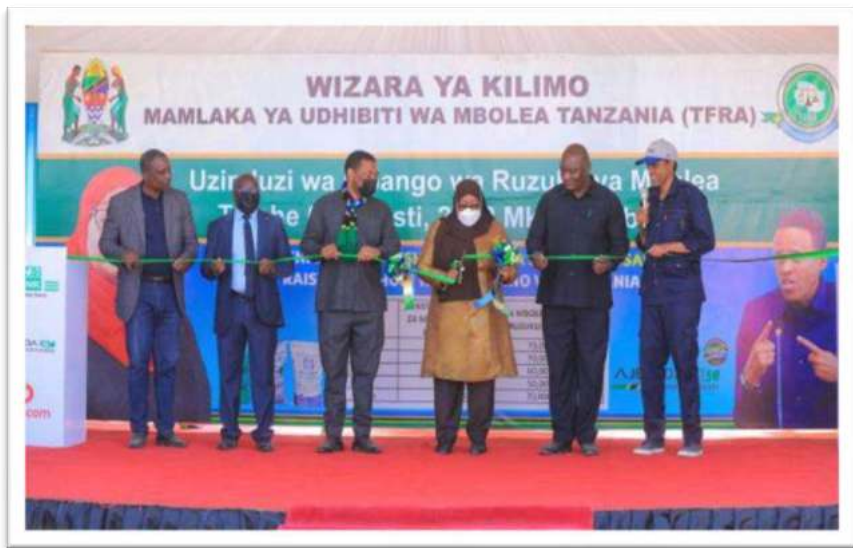
Picha Na.8: Rais wa Jamhuri ya Muungano wa Tanzania Mhe. Samia Suluhu Hassan akizindua Mpango wa Ruzuku ya Mbolea wakati wa Maadhimisho ya Sikukuu ya Wakulima Nananane yaliyofanyika katika viwanja vya John Mwakangale Mkoa wa Mbeya

ya mbolea ili kuhakikisha usambazaji wa mbolea unafanikiwa.