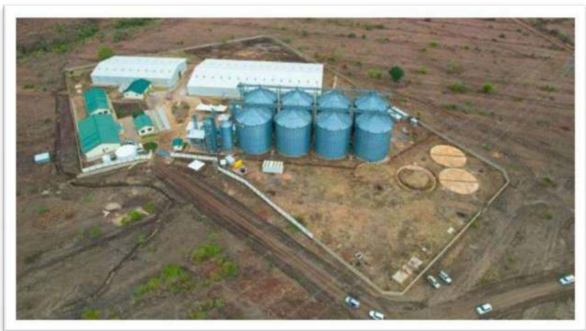
Picha Na.14: Vihenge vya kisasa na ghala ya kuhifadhia Nafaka vilivyo jengwa Babati - Manyara