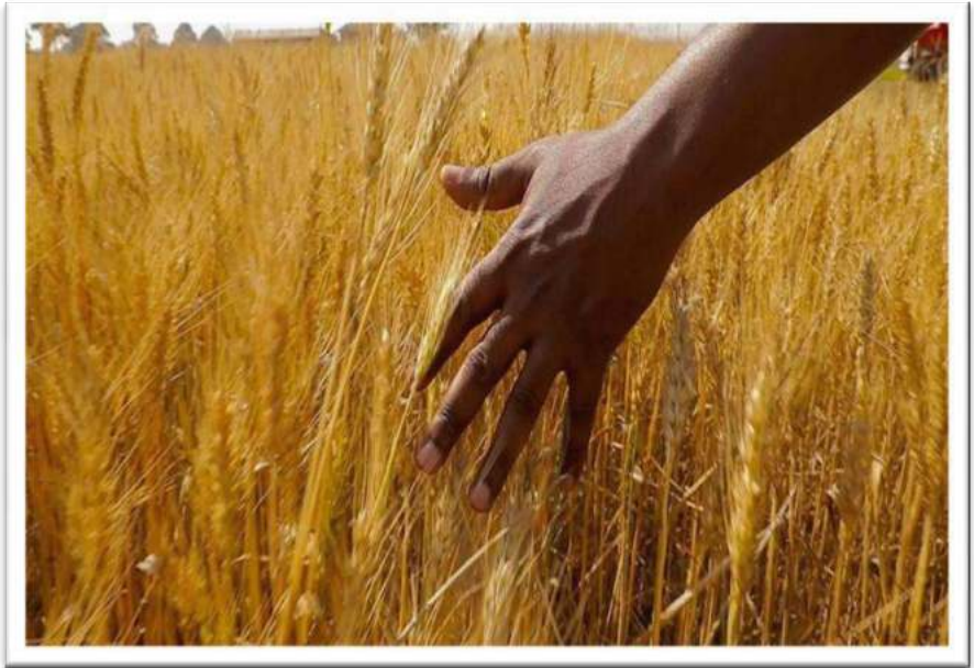
Picha Na.22: Shamba la zao la ngano lililopo Basuto – Manyara