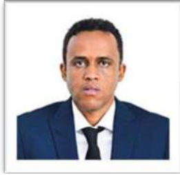
Mhe. Hussein Mohammed Bashe (Mb) Waziri wa Kilimo