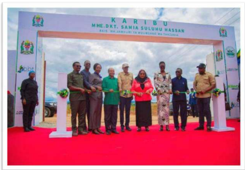
Picha Na.16: Rais wa Jamhuri ya Muungano wa Tanzania Mhe. Dkt. Samia Suluhu Hassan akizindua Mpango wa Kilimo cha Mashamba Makubwa ya Pamoja Chinangali - Dodoma

173. Hadi kufikia Aprili, 2023 ekari 264,841.5 za mashamba makubwa ya pamoja katika Mikoa ya Kigoma, Mbeya, Njombe, Singida, Dodoma na Kagera zimepimwa na kuwekwa mawe ya upimaji kwa ajili ya kuyapatia hati miliki ili yatumike katika utekelezaji wa program hiyo. Aidha, mashamba yaliyoainishwa yatagawiwa kwa vijana waliochaguliwa na kupatiwa mafunzo ya kilimo biashara.