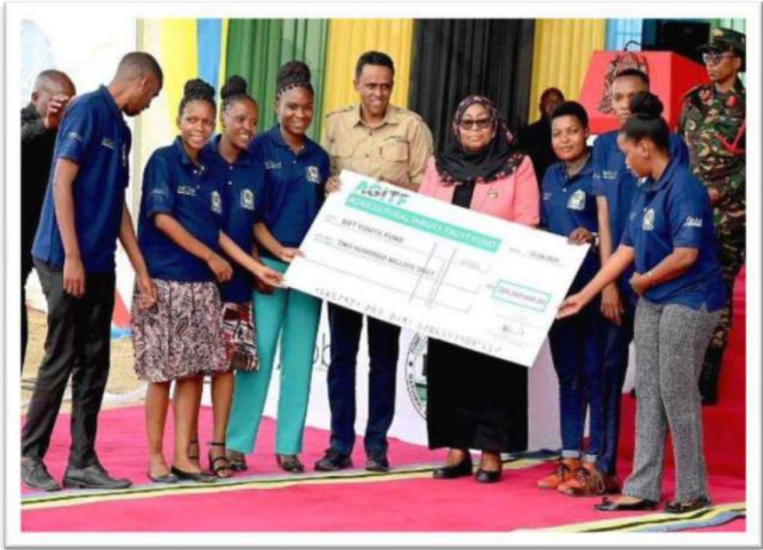
Picha Na. 12: Mheshimiwa Rais wa Jamhuri ya Muungano wa Tanzania akiwakabidhi vijana wa BBT mfano wa hundi ya milioni mia mbili (200) kwa ajili ya shughuli za kilimo kwa vijana hao kwenye mashamba makubwa ya Pamoja (block farms), Chinangali-Dodoma