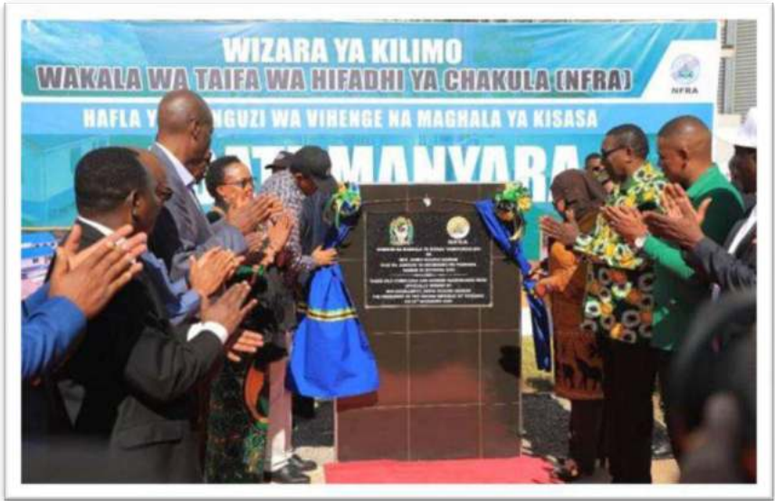
Picha Na.13: Uzinduzi wa Vihenge vya Kisasa na ghala ya kuhifadhia Nafaka Mkoani Manyara-Babati.