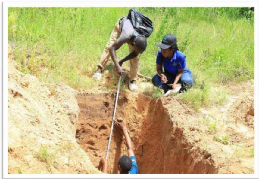
Picha Na.9: Wataalam wa Wizara ya Kilimo wakichukua sampuli za udongo (Soil Profile) katika Halmashauri ya Kigoma.

zimechukuliwa katika mashamba hayo kwa ajili ya kupima afya ya udongo. Matokeo ya vipimo yatatumika kutoa ushauri wa mazao stahiki na matumizi sahihi ya mbolea.