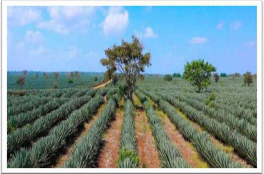
Picha Na.18: Shamba la Mkonge lililoendelezwa Kingolwira – Morogoro