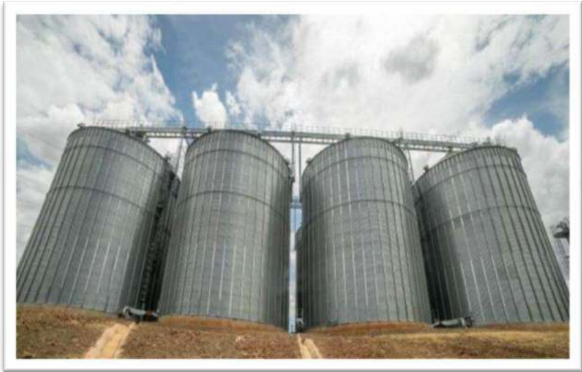
Picha Na. 1: Vihenge vya Wakala wa Taifa wa Hifadhi ya Chakula (NFRA) - Kigoma.