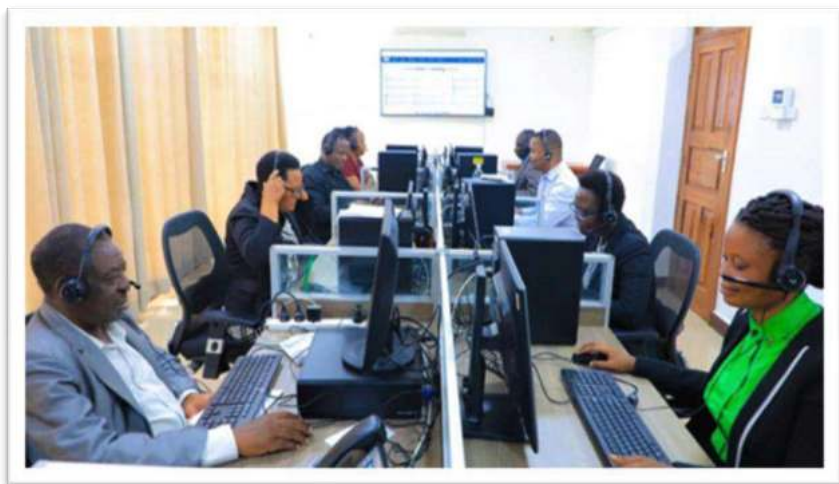
Picha Na.10: Wataalam wa Wizara wakitekeleza majukumu yao ndani ya Kituo cha Huduma kwa Wateja (Call Center)

121. Mheshimiwa Spika , Wizara imeendelea kuimarisha huduma za ugani nchini kwa kuboresha mazingira ya utoaji huduma hizo kwa wakulima. Hadi kufikia Aprili 2023, Wizara imenunua na kusambaza samani (viti 1,020 na meza 23) katika katika Vituo vitano (5) vya Rasilimali za Kilimo vya Kata (WARCs) katika mikoa ya Dodoma, Singida na Simiyu. Vilevile, Wizara imesambaza matrekta madogo (powertiller) 11 katika WARCs za Mikoa ya Dodoma, Morogoro, Singida, Iringa, Mwanza, Geita, Lindi, Songwe na Mbeya.