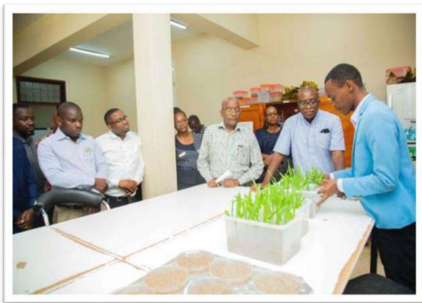
Picha Na.3: Naibu Waziri wa Kilimo Mhe. Anthony Mavunde akipata maelezo kutoka kwa mtaalamu wa maabara ya Taasisi ya Kudhibiti Ubora wa Mbegu Tanzania (TOSCI)- Morogoro.

88. Vilevile, TOSCI imetoa vibali 1,094 vya kuagiza mbegu nje ya nchi tani 10,139.8. Katika kudhibiti ubora wa mbegu, TOSCI imetoa lebo 10,789,641 ambazo ni sawa na uzito wa tani 21,492.71 za mbegu. Vilevile, TOSCI imetoa mafunzo na kuwasajili wazalishaji wa miche ya parachichi 487.