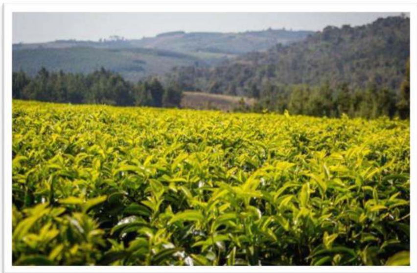
Picha Na. 19: Shamba la chai lililopo Mkoa wa Njombe

190. Mheshimiwa Spika , katika mwaka 2022/2023 Wizara kupitia Bodi ya Chai Tanzania ililenga kuzalisha tani 30,000 za chai kavu ambapo hadi kufikia Aprili, 2023 uzalishaji umefikia tani 8,047 na uzalishaji unaendelea. Pia, Wizara kupitia Bodi ya Chai imesimamia ukarabati wa kiwanda cha chai cha Mponde ambapo hadi kufikia Aprili, 2023 uzalishaji wa chai umefikia tani 44 za majani mabichi na tani 90 za chai kavu. Vilevile, Bodi kwa kushirikiana na wadau imeendelea kufufua shamba la chai la Kilolo ambapo hadi kufikia Aprili, hekta 32 zimefufuliwa.