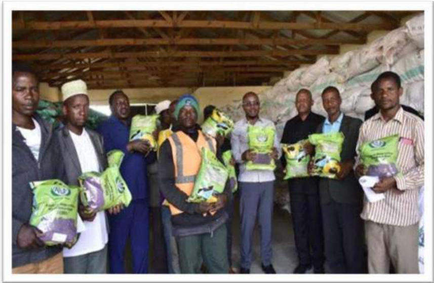
Picha Na.7: Baadhi ya wakulima wa Mkoa wa Singida waliopatiwa mbegu za alizeti kwa ruzuku.

110. Mheshimiwa Spika, Wizara ilipanga kusambaza mbegu na miche bora kwa mpango ruzuku ya mazao kujigharamia yenyewe kupitia Bodi za Mazao. Hadi kufikia Aprili 2023, Bodi ya Pamba Tanzania, imesambaza mbegu za pamba tani 22,146 katika Wilaya 56 kwenye Mikoa 17 inayolima zao la pamba; kupitia Bodi ya Korosho Tanzania imesambaza miche bora ya korosho 11,000 katika Mikoa 13; kupitia Bodi ya Mkonge Tanzania imesambaza miche ya Mkonge 12,633,536 katika Halmashauri za Muheza, Korogwe, Handeni, Kilosa, Mkinga, Singida, Tarime, Bunda, Rorya, Mkuranga, Rufiji, Ruangwa, Bariadi, Shinyanga na Same.