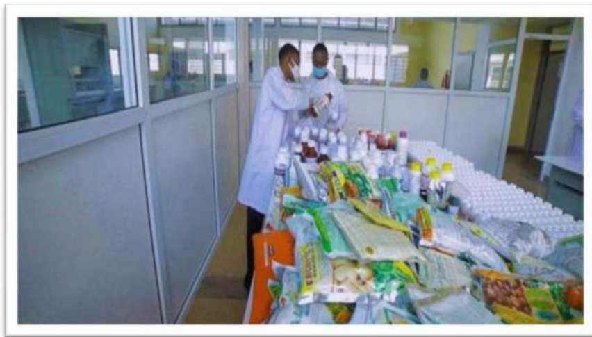
Picha Na.4: Maabara maalum inayosimamiwa na Mamlaka ya TPHPA kwa ajili ya uhakiki wa viuatilifu kabla ya kwenda kutumika mashambani

97. Mheshimiwa Spika , ili kuimarisha upatikanaji wa viuatilifu vyenye ubora, TPHPA imekagua jumla ya maduka 314 katika Mikoa ya Tabora (54), Shinyanga (26), Geita (41), Mwanza (60), Simiyu (32), Mara (28), Dar es Salaam (10), Morogoro (8), Mbeya (4), Ruvuma (1), Iringa (35) na Songwe (15) ili kudhibiti uwepo wa viuatilifu visivyotambuliwa na ubora.