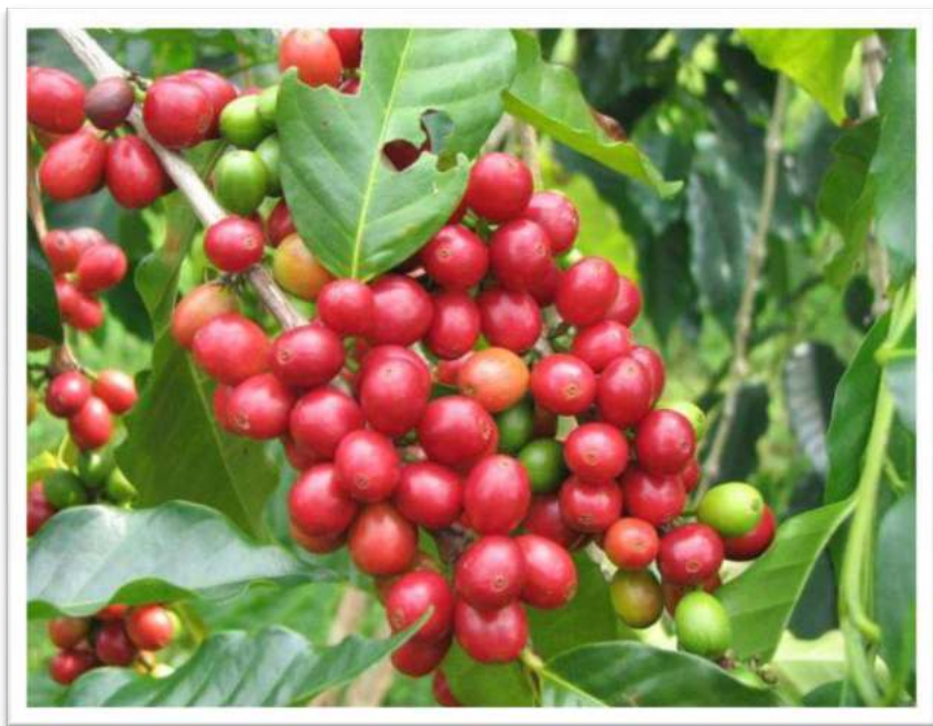
Picha Na.20: Zao la kahawa likiwa shambani

197. Mheshimiwa Spika , Bodi imesambaza mizani za kidigitali 300 katika vituo vya kuuza kahawa katika Mkoa wa Kagera na ukarabati wa ghala 50 umefanyika. Vilevile, hadi Aprili, 2023 jumla ya miche bora ya kahawa 8,894,120 imezalishwa ambapo Arabika ni miche 5,169,858 na Robusta ni miche 3,724,262. Kati ya miche iliyozalishwa miche 5,977,868 imesambazwa kwa wakulima na usambazaji unaendelea.