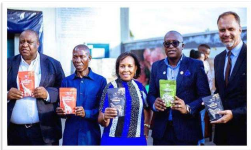
Picha Na. 11: Naibu Waziri wa Kilimo Mhe. Anthony Mavunde akiwa na wadau wa kilimo wakiwa wameshika pakiti za korosho iliyowekwa chapa ya Tanzania

136. Wizara kwa kushirikiana na Sekta binafsi imewezesha uwekaji wa chapa (branding) kwenye mazao mbalimbali ikiwemo korosho zinazobanguliwa na parachichi na kuuzwa nje ya nchi ili kuyatambulisha na kuyatofautisha na mazao yanayozalishwa nchi nyingine. Aidha, Wizara inaendelea na jitihada za uwekaji chapa kwenye mazao mengine yanayosafirishwa nje ya nchi.