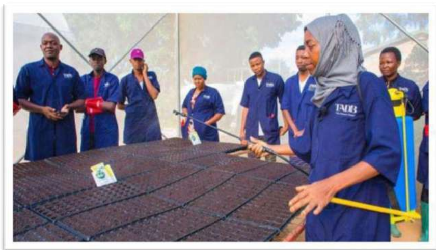
Picha Na. 17: Vijana wakipatiwa mafunzo ya uzalishaji wa miche katika kituo Atamizi cha Bihawana Mkoa wa Dodoma kupitia Programu ya Jenga Kesho iliyo Bora (BBT).

175. Aidha, Wizara imekamilisha taratibu za uchambuzi ambapo vijana 812 wamekidhi vigezo vya kupata mafunzo ya kilimo biashara katika awamu ya kwanza. Kati ya hao, wanawake ni 282 na wanaume 530. Pia, vijana hao wamewasili katika vituo atamizi 13 na mafunzo yanaendelea. Mafunzo hayo yanatolewa kwa kipindi cha miezi minne (4) na yatakamilika Agosti 2023 ambapo uchambuzi wa kundi la pili na tatu unaendelea. Baada ya kuhitimu mafunzo hayo, vijana na wanawake hao watapatiwa mashamba yenye ukubwa usiozidi ekari 10 kulingana na aina ya mazao. Mashamba hayo watakayopewa watapewa umiliki (sub leasing) kwa miaka 66 na kumilikishwa ardhi.