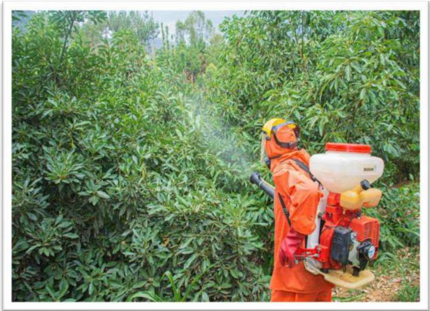
Picha Na. 5: Udhibiti wa visumbufu katika zao la parachichi

100. Mheshimiwa Spika, Mamlaka imesajili viuatilifu vipya 160 kwa ajili ya matumizi nchini na imetoa vibali 19 vya kuingiza viuatilifu nchini na hati 125 za usajili wa viuatilifu. Pia, imechambua ubora wa viuatilifu 407 ambapo vyote vilikuwa salama na vyenye ubora na kukagua shehena 791 za mimea zilizokuwa zinaingia nchini na kubaini visumbufu 39 vya kikarantini ambapo mimea hiyo imewekwa kwenye karantini kwa ajili ya uchambuzi.