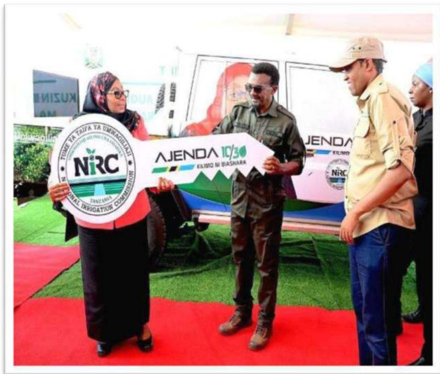
Picha Na.2: Rais wa Jamhuri ya Muungano wa Tanzania Mhe. Dkt. Samia Suluhu Hassan akimkabidhi funguo Mkurugenzi Mkuu wa Tume ya Taifa ya Umwagiliaji Bw. Raymond W. Mndolwa

67. Mheshimiwa Spika , Tume imenunua magari 53 sawa na asilimia 139.5 ya lengo kwa thamani ya Shilingi 8,338,859,725 kwa ajili ya kuimarisha usimamizi wa shughuli za umwagiliaji kupitia ofisi za umwagiliaji za Wilaya; na imenunua mitambo 15 sawa na asilimia 125 ya lengo na magari makubwa (heavy trucks) 17 kwa thamani ya Shilingi 15,603,742,179 kwa ajili ya ujenzi na ukarabati wa miundombinu ya umwagiliaji. Taratibu za manunuzi ya vifaa vya upimaji (land survey equipment) zinaendelea.