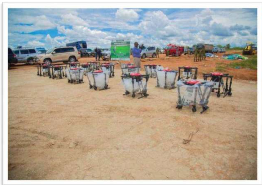
Picha Na.21: Ndege zisizo na rubani (drones) zilizonunuliwa na Bodi ya Pamba zitakazotumika katika unyunyuziaji wa viuatilifu katika mashamba ya pamba.

ili kurahisisha udhibiti wa visumbufu vya zao la pamba.